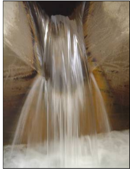
図2 浄水場に集まる地下水