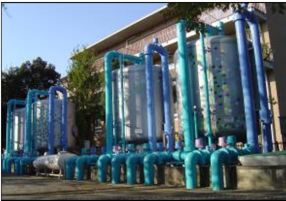
図3 除鉄・除マンガンろ過装置