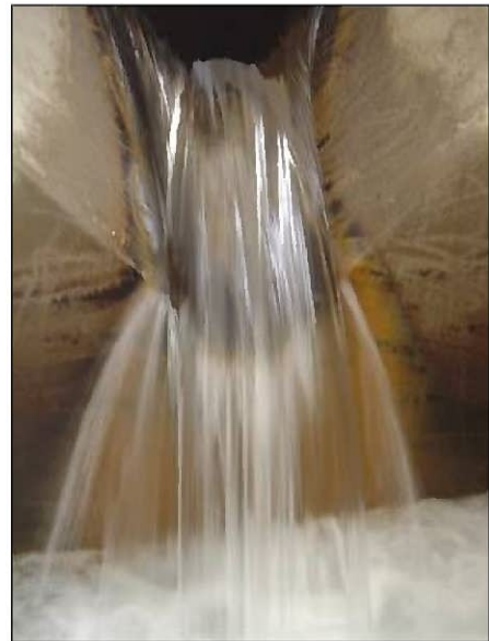
図2 浄水場に集まる深井戸の地下水