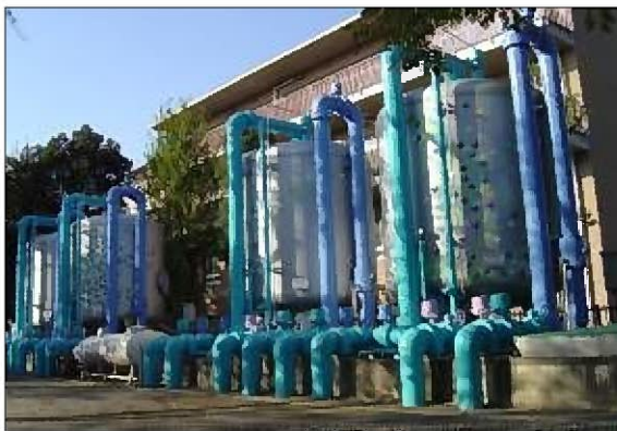
図3 除マンガン除鉄ろ過装置