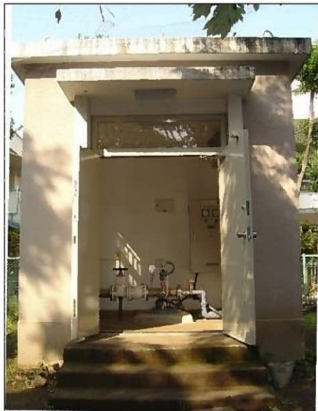
図1 深井戸水源の外観