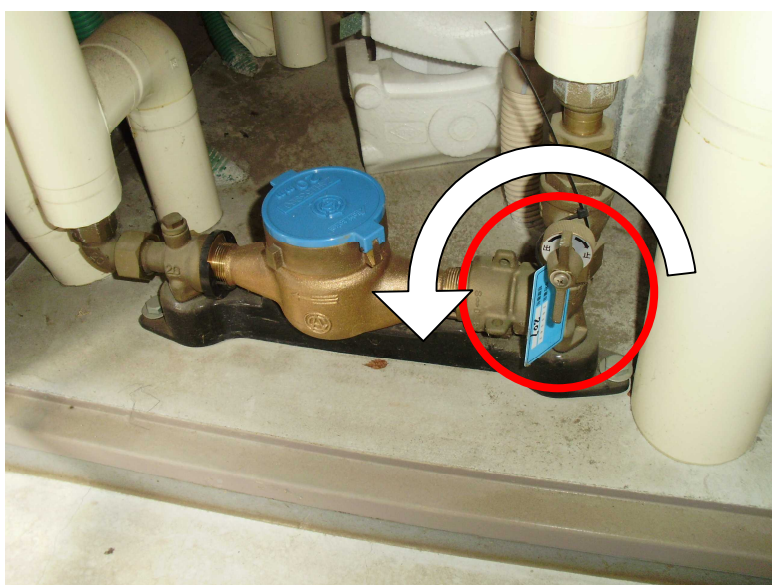
玄関扉付近のパイプスペース等に設置しているメータのとき （写真は「開」の状態です）

栓はおおむね上記のように設置してありますが、位置が不明で水が出ない場合は、ご連絡ください。