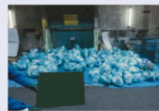
集められた「燃やすごみ」の量732.2kg

市内3地区（吉祥寺・境・中央）の住宅から「燃やすごみ」200kgずつを目安に回収し、回収量計732.2kgのうち63.1kgの組成分析を行いました。