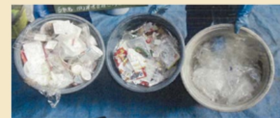
汚れていないプラスチック製容器包装 など