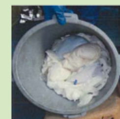
おむつ(ペット用除く)