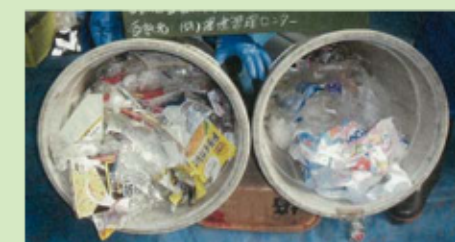
汚れたプラスチック製容器包装 など