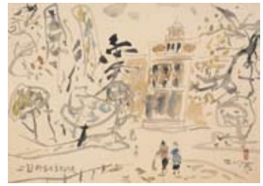
《上野科学博物館》制作年不詳