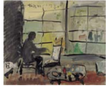
《室内(箱根にて)》制作年不詳