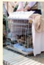
昨年、井の頭公園で開催された譲渡会では、50匹の里親が決まりました