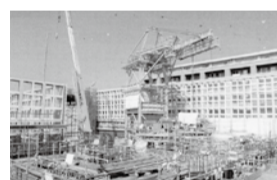
吉祥寺東町1丁目現場状況

市内の下水道の約9割が、雨水と生活排水などの汚水を同じ下水道管で流す「合流式」で整備され、下流の処理場の能力を超える雨が降ると、未処理のまま河川に放流されてしまいます。市では、河川への放流回数を少なくするため、雨天時に一時的に汚水混じりの雨水を貯留させる施設の工事を進めています。今年度中にすべての事業が完了予定です。