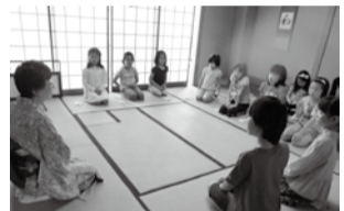
はじめてのお作法にドキドキ

中央コミセンでは、3大事業(コミセンまつり・文化祭・もちつき)のほか、各運営委員が企画・立案した20以上の事業があります。その一つである「Nティーズ」出演の生ライブが5月に行われました。当日は130名以上の地域の方がライブを楽しみ、元気に一年がスタートしました。