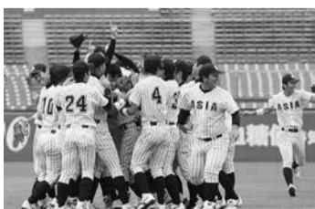
“全員野球”で勝ちとった優勝

亜細亜大学硬式野球部が、東都大学野球春季リーグで見事優勝を果たしました。勝点で駒澤大学、國學院大學と並んだものの勝率で上回り、混戦を制しました。一昨年初、昨年春・秋に続くリーグ優勝となり、4連覇はチーム史上初、リーグ史上でも過去に2度しかない快挙です。通算では21回目の優勝となります。全日本大学野球選手権大会にリーグ代表として出場し、大学日本一を目指します。おめでとうございます。