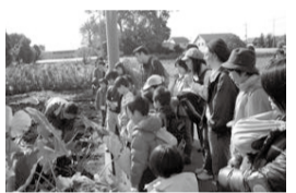
親子食育ウォーキング

チャレンジキッズ・食べ力のびのび教室・親子食育ウォーキングのいずれかを出前型で開催/市内在住・在学・在園の5歳～小学3年生と保護者5組10名以上/☎☎随時、健康づくり支援センター(保健センター内)☎51-0793へ