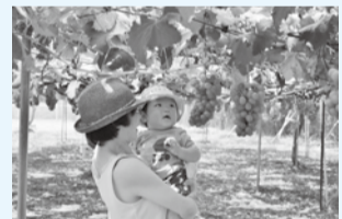
「はじめてのぶどう狩り」 石内紀弘