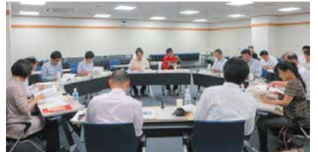
6月スタートした市民会議では、さまざまな課題や意見が出されています

長期計画は、市の長期計画条例に基づき、市政運営の基本理念や実施すべき施策などについて定めた市の最も重要な計画です。現在の第五期長期計画は平成24年度から33年度までの10年間を計画期間としていますが、計画の策定後に生じたさまざまな社会情勢の変化などに対応し、計画の実行性を保つために、28年度から32年度までの5年間を計画期間とする調整計画を今年度から2カ年かけて策定します / 企画調整課 ☎60-1801