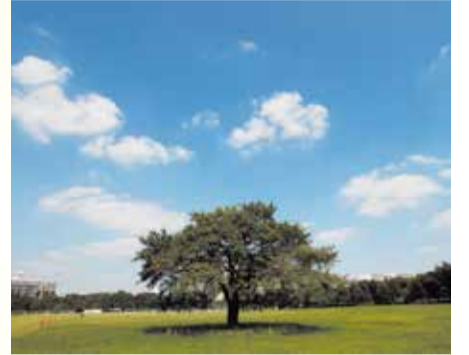
かつて中島飛行機武蔵製作所があった都立武蔵野中央公園

今年には武蔵野に初めて空襲があった昭和19年11月24日から70年の節目の年です。市では、この「11月24日」を「武蔵野市平和の日」と定め、戦争の悲惨さや平和の尊さを後世につなげていくためさまざまな取り組みを行っています。今年も市民の皆さんとともに平和の日イベントを実施し、平和へのメッセージを発信していきます / 市民活動推進課 ☎60-1829