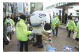
▲街頭キャンペーン