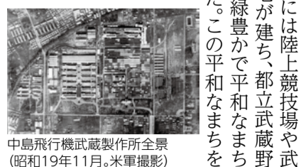
中島飛行機武蔵製作所全景(昭和19年11月。米軍撮影)

終戦の前年、1944年(昭和19年)11月24日、当時の武蔵野町にあった中島飛行機武蔵製作所周辺は爆撃機B29による空襲を受け、工場だけでも死者57人、負傷者75人を数える大きな被害となりました。この空襲は米軍による本格的な本土攻撃の第一波となり、全国的な空襲へとつながります。その後、武蔵製作所に対する空襲は9回にも及び、工場のみならず周辺の住宅地まで被害を受け、幼い子どもや学生を含む一般市民も犠牲となっています。また、8月9日に長崎市に原爆を投下したB29がその10日前に、この武蔵製作所周辺で原爆の模擬爆弾を投下したことも伝えられています。このような戦争の悲惨さは、次世代に語り継ぎ、二度と同じ過ちを繰り返してはなりません。