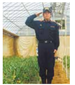
自慢のトマト畑の中で

Q 今後の目標は 災害があった時に地元の人を助けられるように、しっかりと訓練を重ねていきたいです。