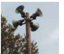
防災行政無線屋外スピーカー

◎防災行政無線の放送内容を電話で確認できるようになりました:住宅の高気密化などにより、防災行政無線屋外スピーカーの放送内容が聞き取りにくい場合があるため、放送した内容を電話で確認できるサービスを開始しました。利用方法:専用電話☎60-1920におかけください。注意:防災行政無線放送終了後から利用でき、6時間後に消去されます。通話料がかかります/ ■ 防災課☎60-1821