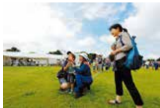
防災フェスタの放水体験