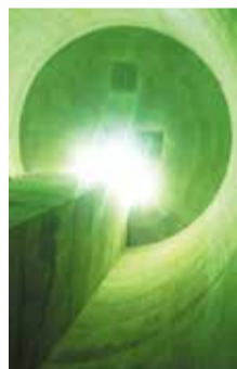
下から見上げた雨水貯留施設

施設名:吉祥寺北町一丁目雨水貯留施設 貯留容量:約4500m 3 /総事業費:11億8920万円