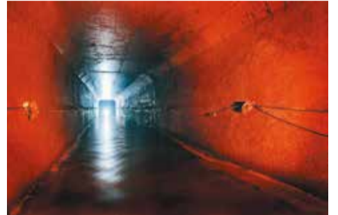
女子大通り幹線/下水道(幅約3.3m×高さ約2.9m)

市では、雨水を浸透・貯留させる施設や河川への未処理下水の放流回数を軽減する施設の設置を進めることで、浸水被害の軽減・水環境の保全に取り組んでいます。また各家庭での浸透施設の設置により地下水が育まれ、水循環の改善につながりますのでご協力ください / 下水道課 ☎60-1914