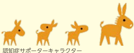
認知症サポーターキャラクター