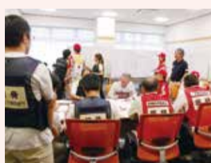
災害時医療救護本部

震災時、武蔵野赤十字病院に設置する災害時医療救護本部の運営を想定し、医療コーディネーターの設置・運用および関係機関との情報連絡訓練などを実施します。