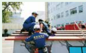
倒壊家屋からの救助訓練

防災関係機関連携訓練 午前11時から武蔵野消防署・市消防団・武蔵野警察署による演習を行います。倒壊家屋からの救助救出訓練、道路啓開訓練、一斉放水訓練など機関による災害時の活動を見学できます。日頃の訓練の成果をご覧ください。