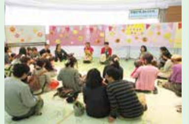
ミニイベントコーナー