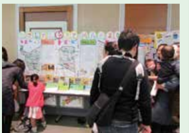
子育て情報コーナー