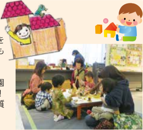
プレーパーク体験コーナー