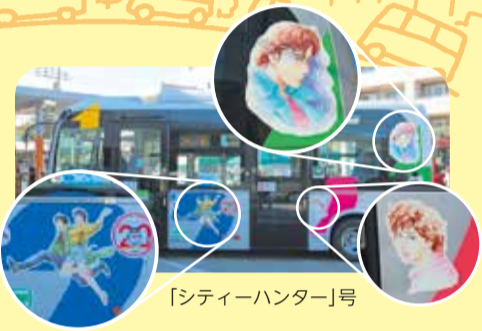
「シティーハンター」号