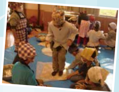
ほうとう作り体験

笹寿司・そば・ほうとうなどの郷土食作り、わらぞうり作りなど。ほうとう作り体験では、地元の人と触れ合いながら、友達と協力して一生懸命作ったほうとうのおいしさを実感していました。