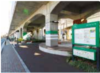
高架下に展開する散歩道「ののみち」

古田 JRとしてもそこは重要だと思っています。「ののみちプロジェクト」を実行しています。高架化で「高架下」という今まで全くなかった空間が生まれました。それをよくある駐車場ではなく、まちの顔として位置付けて、散歩道「ののみち」として活用しようという取り組みです。「ののみち」には、平成26年に開館した「武蔵野ふるさと歴史館」など周辺の施設への案内サイン、名所、武蔵境名物・唐