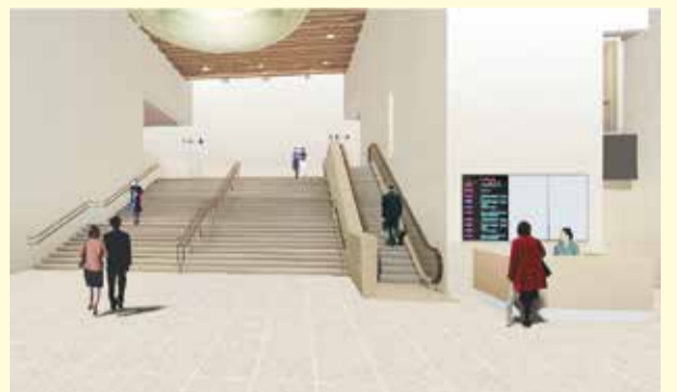
正面玄関エスカレーター設置後のイメージ

市民文化会館(中町3-9-11)は、昭和59年の開館以来、主催事業のほか、アマチュアオーケストラおよび合唱団の発表会、各種講演会など、大・小ホールともに利用率80%を超え、多くの皆様に利用いただいています。一方で、施設・設備の老朽化が進んでおり、今後も引き続き安全・快適に使い続けるためには、劣化への対応とともに、バリアフリーや環境にも配慮した時代のニーズに合った施設として改修する必要があります。市民説明会などを通じて118件にのぼる意見をいただき、また、外部の専門家の意見も参考に、約3年にわたり、より良い施設整備に向け検討を重ね、改修に着手することとなりました。昨年12月に市議会で工事契約の議案が可決され、4月から着工し、約1年の改修整備の後、より利便性の高い施設として、平成29年4月にリニューアルオープンします。☎市民活動推進課 ☎60-1831