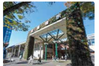
駅南口のシンボルゲート