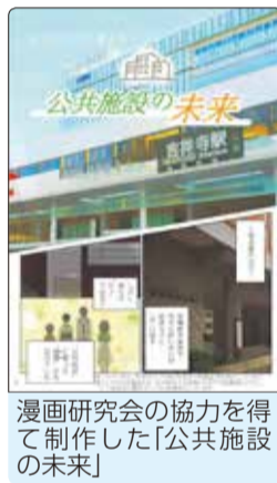
漫画研究会の協力を得て制作した「公共施設の未来」

市長 コミュニケーションのあるまち、ゆったりしているまち、誰もが地域に関わり、ずっと住み続けたいまち。外国の方も受け入れる柔軟さと懐の深さも持っているまち。偉大なるローカルシティ、ローカル・インターナショナルシティといったところでしょうか。古いものを大切に維持し、新しいものを取り込んでいくまち。武蔵境がそんなまちとして発展していくといいですね。本日はありがとうございました。