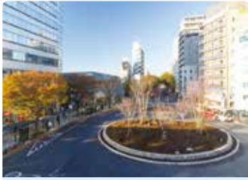
北口駅前広場も完成間近

市長 いよいよ駅北口も整備されて、駅前が華やかで便利になります。未来を展望すると、駅前と同時に、まち全体が活