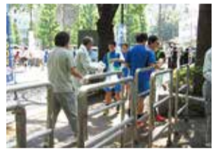
ごみゼロデー 市民・事業者・団体などが協力して清掃活動を実施