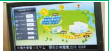
学校での太陽光発電の見える化