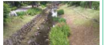
仙川水辺環境整備