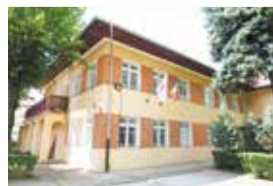
日本武蔵野センター

ルーマニア国ブラショフ市との交流:平成4年にルーマニア国立交響楽団を支援したことから始まり、平成10年にブラショフ市内に「日本武蔵野センター」を設置し、日本語教室・市民交流などを行っています。