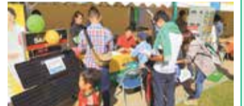
むさしの環境フェスタ