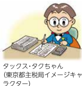
タックス・タクちゃん (東京都主税局イメージキャラクター)

市では、申告が必要と思われる方に、市民税・都民税申告書を2月5日(金)に発送しました。申告書が届いていない方でも、申告が必要な場合がありますのでご注意ください。 ※用紙は市民税課、各市政センター、申告会場にもあります。 市ホームページからも印刷できます。