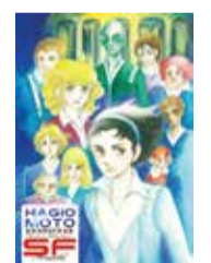
©萩尾望都 / 小学館

4月9日(土)~5月29日(日) / 午前10時~午後7時30分 / 同館企画展示室 / 「ポーの一族」や「トーマの心臓」など不朽の名作を生み、1970年代の少女漫画黄金期を築いた萩尾望都。日本の少女漫画史におけるSFの黎明期を担った萩尾望都のカラーイラストレーション、コミック生原稿など、200点を超えるSF原画が大集合 / 100円(小学生以下・65歳以上・障害者は無料) / 同館