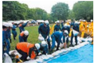
土のうを使用した浸水防止訓練

◎地震対策ひろば...●体験コーナー:起震車体験、ガスメーターの復旧方法●展示:家具転倒防止器具、啓発パネル●子ども用消防服を着て写真撮影(カメラは各自持参)●各ブースを回ってスタンプを集めて「ガチャガチャ」をしよう!