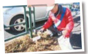
「井ノ頭通り美化活動」吉祥寺西コミセン