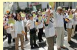
パレード(昨年の様子)

4月16日(土)にコピス吉祥寺ふれあいデッキこもれびでPRイベントを開催しました。