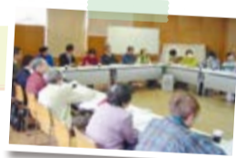
「東部地域防災」本宿コミセン

各コミュニティ協議会をはじめとした地域の諸団体を中心となって、さまざまなテーマや方法で地域フォーラムが開催されています。「みんなでやってみよう!!地域フォーラム」(4月発行)より、コミュニティ協議会へのインタビュー記事を一部紹介