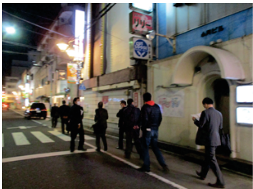
③弁天通り商店街の一角