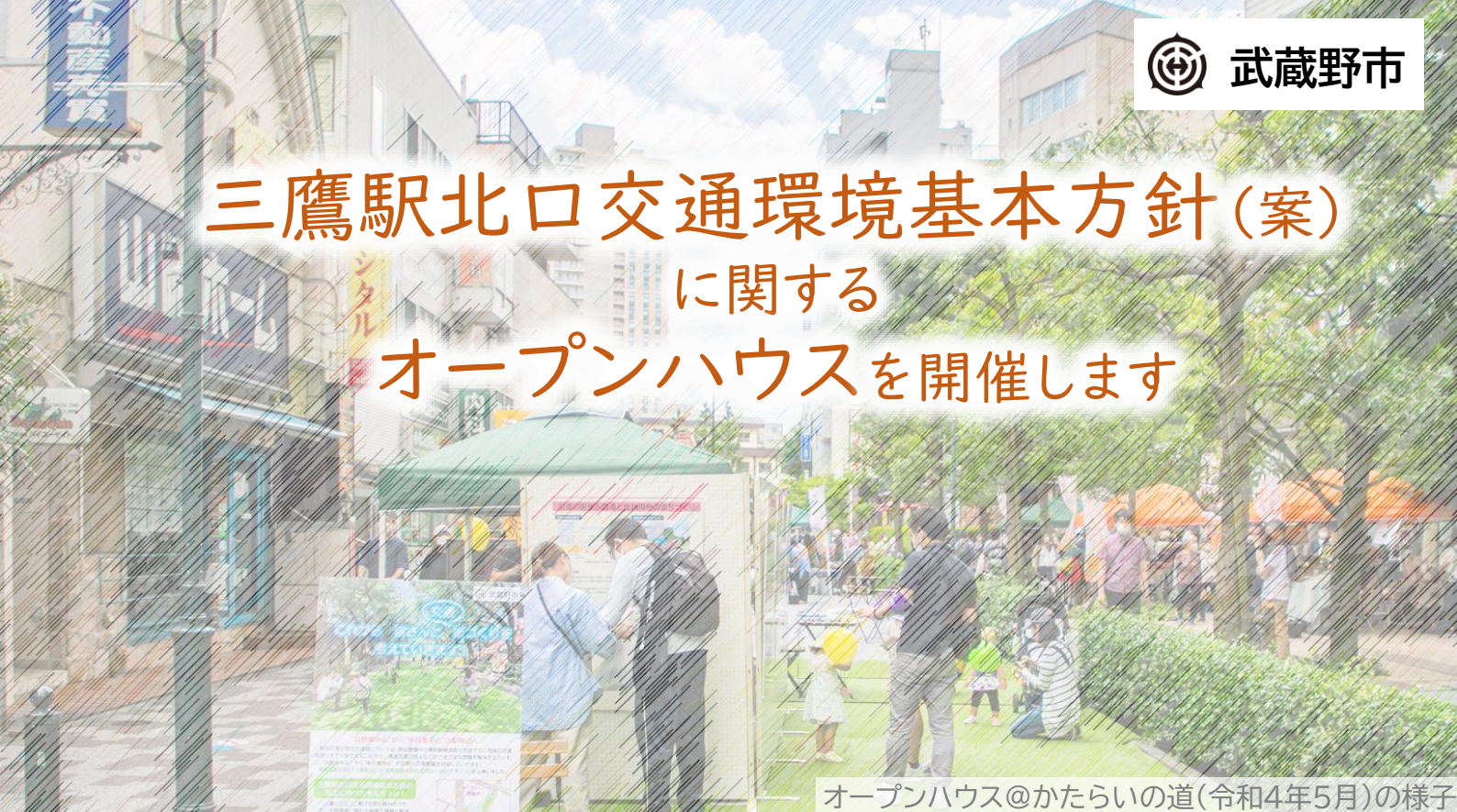
オープンハウス@かたらいの道(令和4年5月)の様子

歩行者中心のにぎわいのある駅周辺を目指し、主に交通環境の視点で課題とその解決のための方針をまとめた交通環境基本方針(案)について、意見募集(パブリックコメント)を行います。