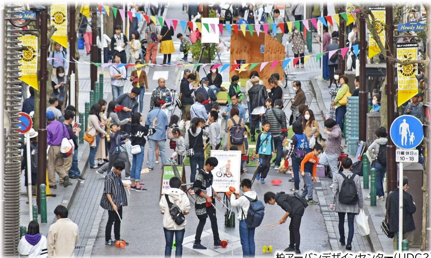
柏アーバンデザインセンター(UDC2)