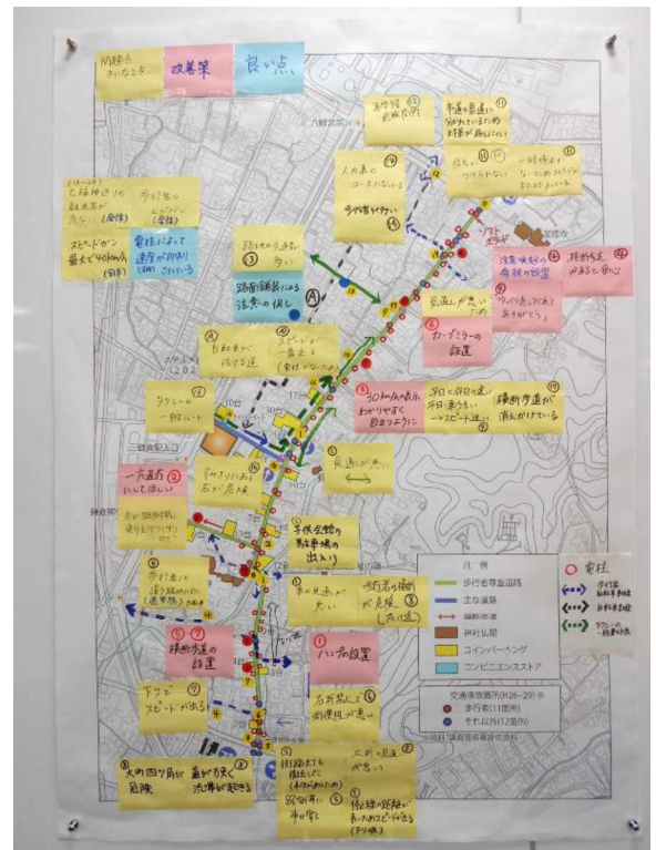
ポストイットを貼った台紙のイメージ (成果)