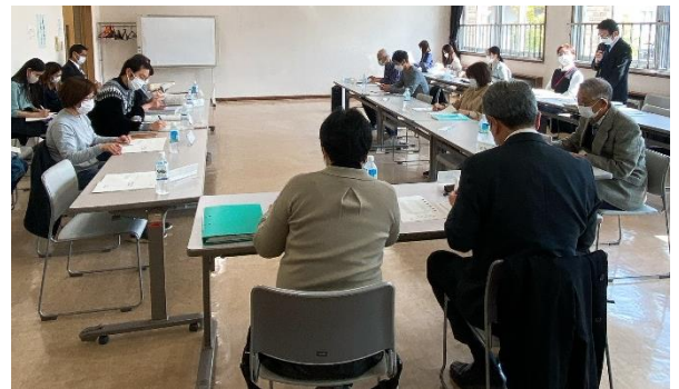
第7回改築懇談会の様子

引き続き改築懇談会・説明会等を開催し、広く皆様にご意見をいただきながら進めていきます。