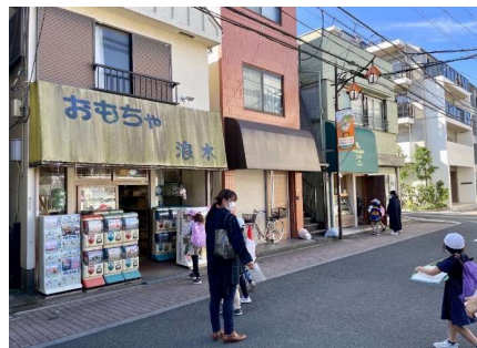
まちたんけん (生活科)