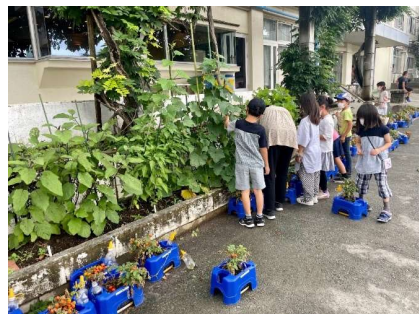
ランチルーム前の花壇