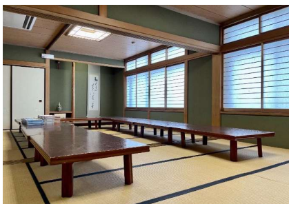
ランチルーム和室