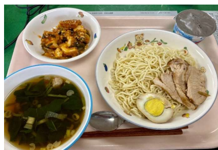
自慢の自校式給食