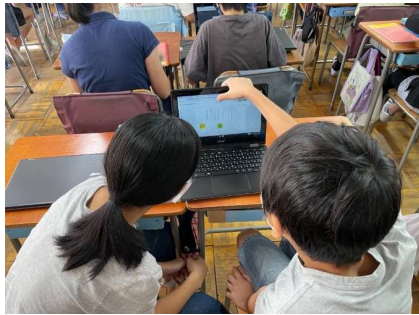
「やり取り」を重視した授業