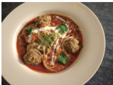
チョルバdeうどん (麺は武蔵野地粉うどんを使用) 武蔵野市の郷土料理とルーマニアの伝統料理を融合させたメニュー