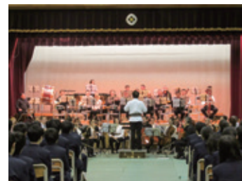
11月27日 武蔵野北高等学校 コンサートの様子

【市制施行70周年記念 武蔵野市・ブラショフ市 友好交流25周年記念コンサート 武蔵野市友好と平和の第九ルーマニア・ブラショフ・フィルハーモニー交響楽団】