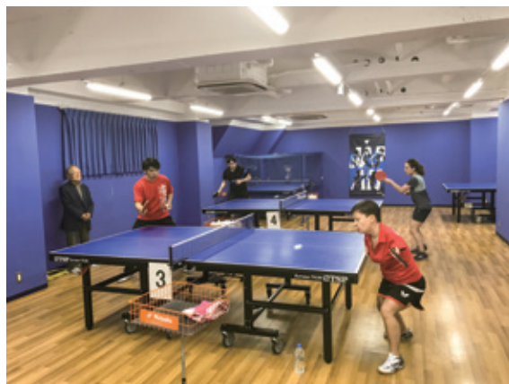
タクティブ立川のコーチと練習する タビタ選手とガブリエラ選手