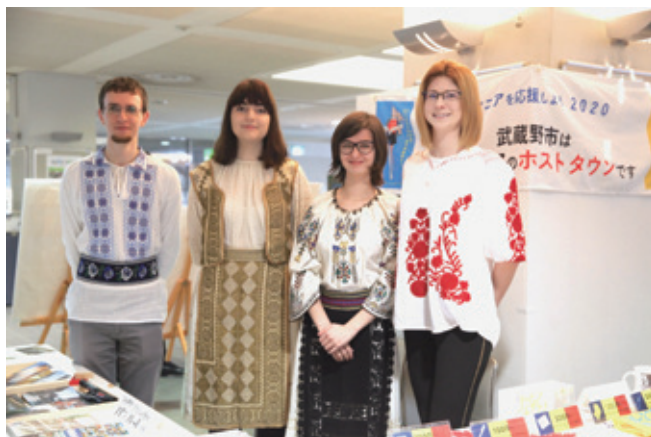
Sports for Allイベントでルーマニア紹介とホストタウン事業のPRをしてくださいました