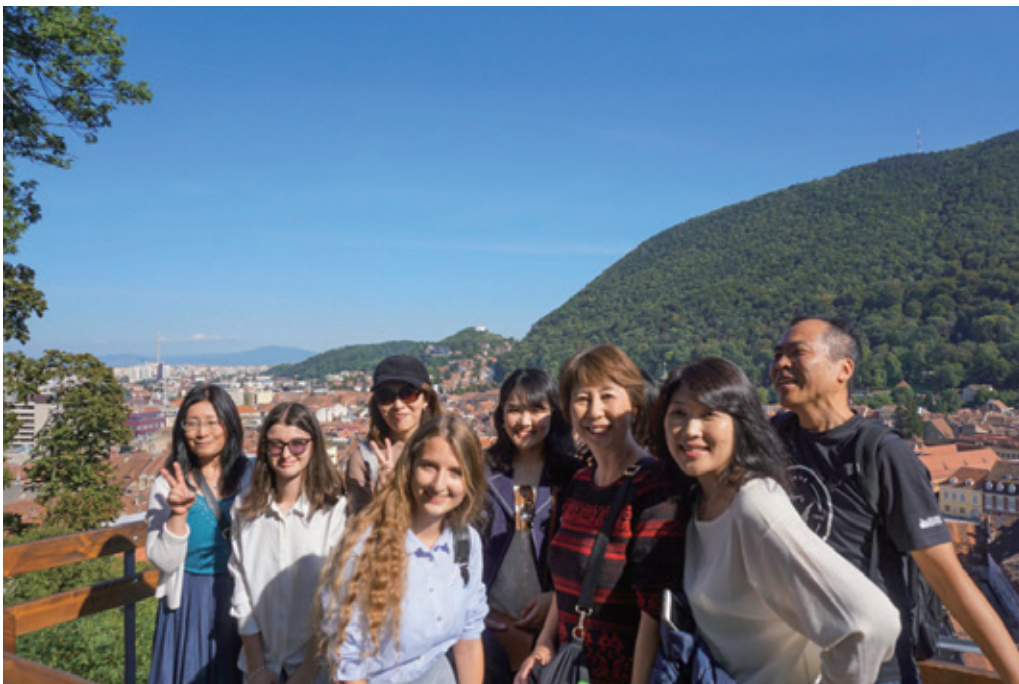
日本武蔵野センターの学生にブラショフ市を案内してもらう市民団