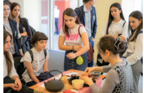
日本・武蔵野文化フェスティバルにて お茶の作法を披露

15名の合唱団員はブラショフ・フィルハーモニー交響楽団と再び共演をはたし、14名の文化交流団員は「日本・武蔵野文化フェスティバル」を開催し、武蔵野市のホストタウンのPRや日本文化の発信などを行いました。ブラショフ市民とたくさんの出会いがあり、29年続く友好交流の歩みに新たな歴史を刻みました。