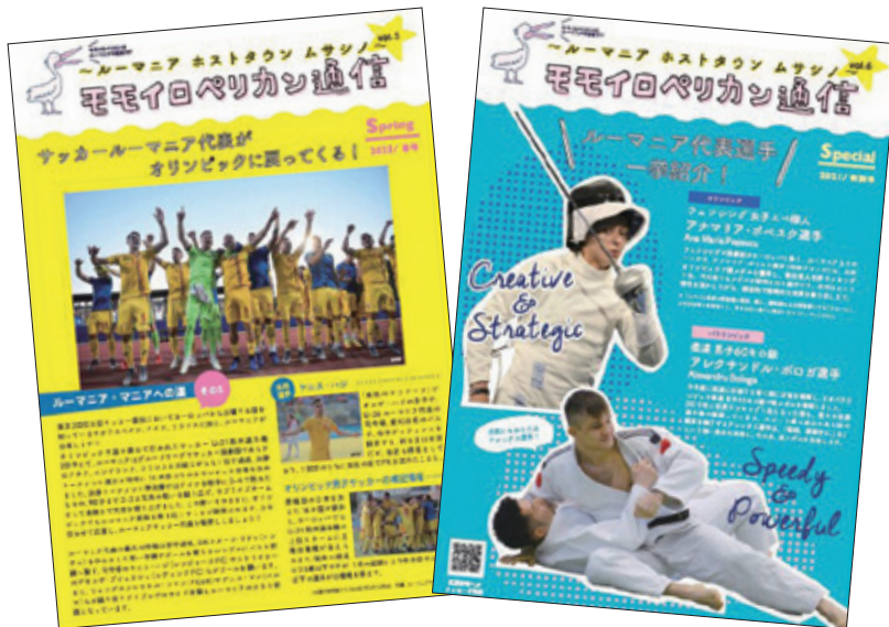
モモイロペリカン通信表紙 タイトルはルーマニアの国鳥（非公式）に由来します

ルーマニアやホストタウン事業について紹介するホストタウン通信をVol. 7号まで発行し、ルーマニアの生活文化や観光地、ホストタウン事業報告、ルーマニア選手と東京2020大会の成績紹介、成蹊大学ルーマニア交流プロジェクトの連載など様々なトピックを取り上げて紹介しました。