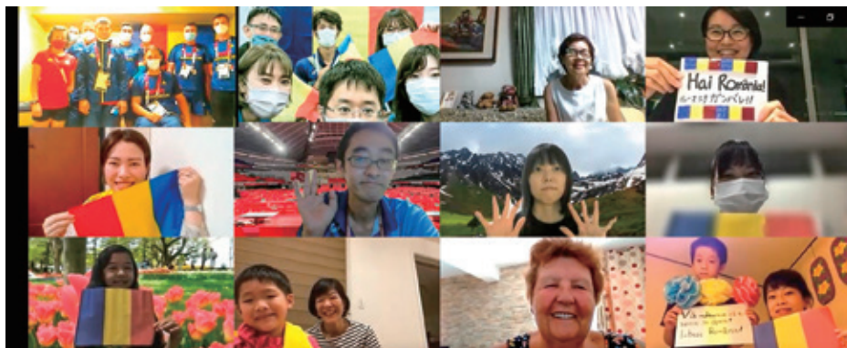
選手と参加者で記念撮影