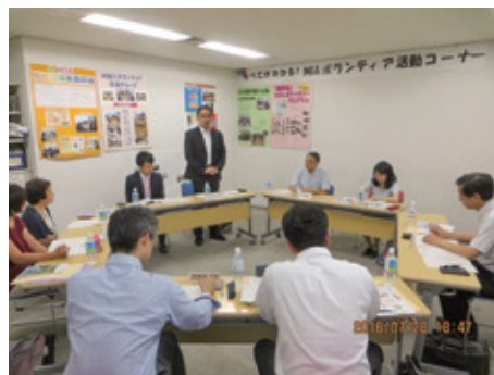
第一回ルーマニアホストタウン懇談会

武蔵野市らしいホストタウン事業を実現していくため、平成28年度に当市とルーマニアに縁のある方で構成する「ルーマニアホストタウン懇談会」を開催して、その方針をまとめ、実施にあたっては「ホストタウン事業推進実行委員会」を設置して、具体的な取組みを推し進めてきました。