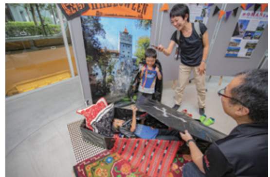
ハロウィン ブラン城のフォトスポット

■内 容：ハロウィンにちなんでドラキュラ城として有名なブラン城をテーマに謎解きやドラキュラのマント作りなどを行いました。マントを着て写真を撮るブラン城のフォトスポットも人気でした。