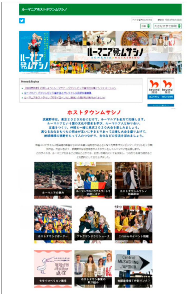
ホストタウン専用ホームページ