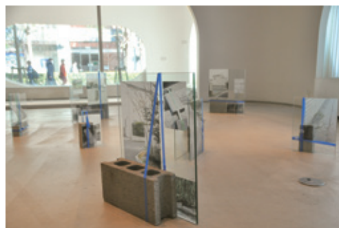
滞在中撮影した写真を使った インスタレーション作品