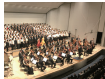
11月23日 武蔵野市友好と平和 の第九コンサートの様子