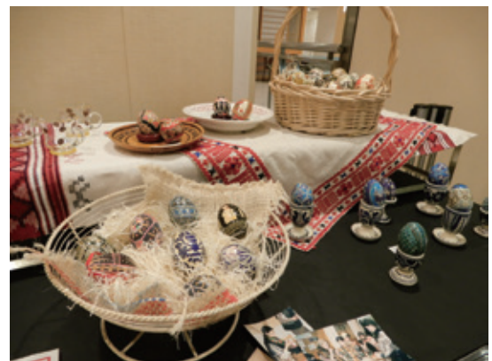
模様が異なる美しいイースターエッグ

■内 容：復活祭(イースター)はルーマニア人にとって重要な行事。模様が異なる約100点のイースターエッグや各地方の焼き物約50点を展示し、ルーマニアの生活文化を紹介しました。