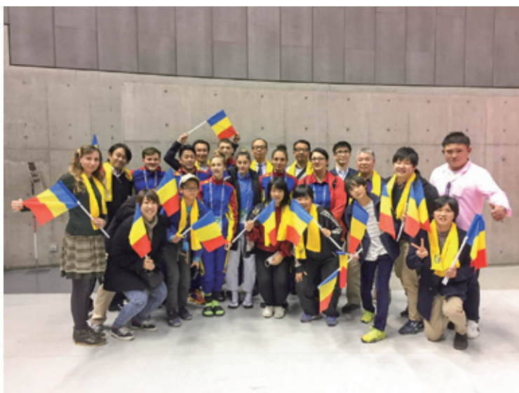
柔道グラウンドスラムでルーマニア柔道選手団の応援