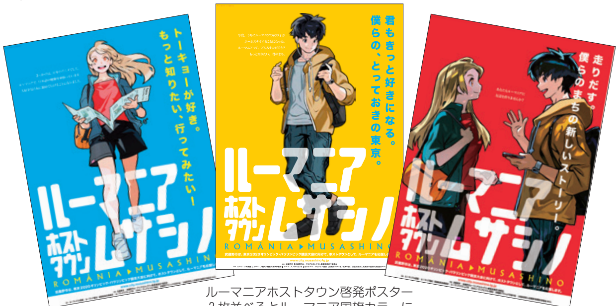
ルーマニアホストタウン啓発ポスター 3枚並べるとルーマニア国旗カラーに

ホストタウン公式キャラクターのショータとアレクサンドラのポスターは、2人の出会いまでのストーリー性を持たせた3部作として制作し、ホストタウン事業の啓発を行いました。ルーマニアの情報やホストタウン事業はリーフレットにまとめ、ルーマニアホストタウンPRブース出店時などに市民へ広く配布しました。