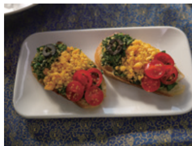
小松菜のルーマニア国旗カナッペ 東京GAP食材武蔵野産小松菜を使ったおもてなし料理