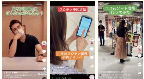
副反応への対処方法や接種予約の方法などを動画コンテンツで紹介しています