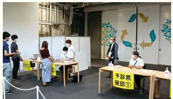
むさしのエコre ゾート会場の様子（9月撮影）

当日にならないと予定が分からない方や、急に都合が合った方などが接種を受けられるよう、「むさしのエコre ゾート会場」において9月26日から10月16日まで、予約不要の接種を実施しました。合計87名が予約なしで接種しました。