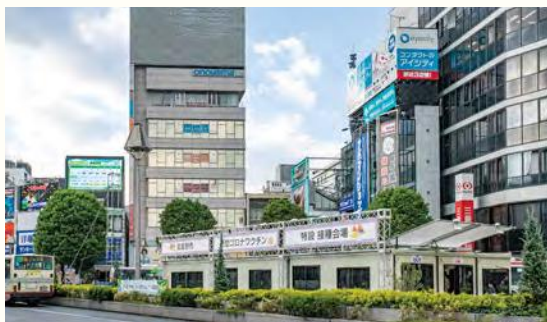
吉祥寺駅北口駅前広場特設会場（10月撮影）

特に若い方の接種を推進するため、アクセスの良い吉祥寺駅北口駅前広場に特設会場を設置し、10月9日から11月21日までの間、1・2回延べ4957回接種しました。平日は、夜間接種（午後8時まで）を受けられる環境を整えることで、仕事や学校などで日中の接種が難しい方の接種が可能になりました。