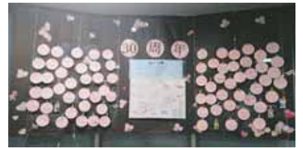
記念の地域MAPと寄せ書き

これからはWi-Fiの設備も整い、コミセンのありさまも変化していきます。オンライン事業も広がっていくことと思います。すでにオンラインを利用しての運営委員会、講演会では