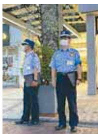
安全パトロール隊員「ブルーキャップ」

吉祥寺駅周辺の「勧誘行為等適正化特定地区」内では、安全パトロール隊員「ブルーキャップ」による警告などの対象となります。