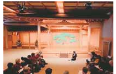
国立能楽堂研修能舞台