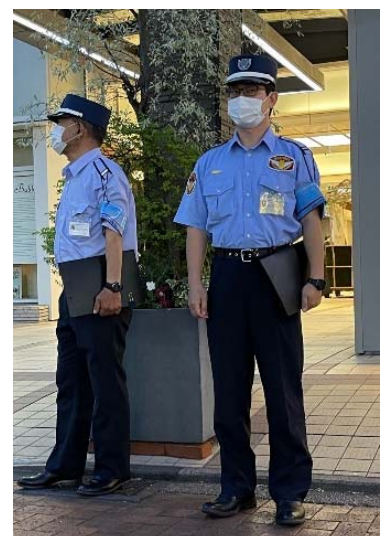
安全パトロール隊員 「ブルーキャップ」