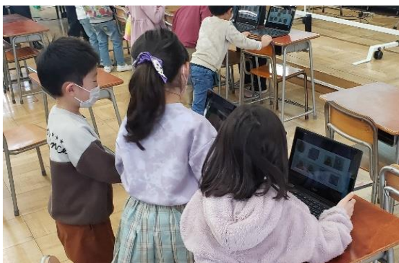
【学習者用コンピュータを使ってリズム打ちをする小学校1年生】

学習者用コンピュータの活用は、小学校1年生から進んでいます。授業中に活用するだけでなく、委員会活動や係活動、学校行事等、授業以外の場面でも積極的に活用されています。