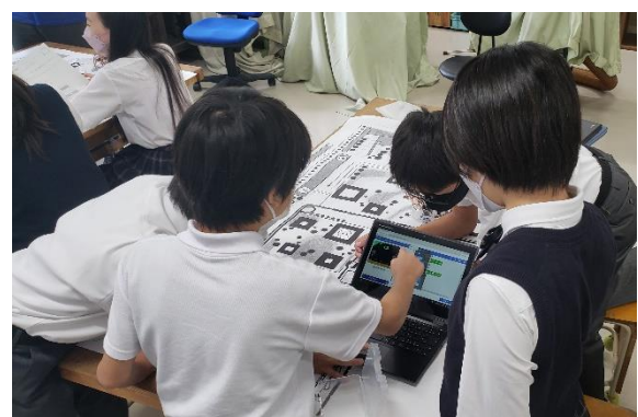
【プログラミングをしている様子】

子どもたちは、学習者用コンピュータを活用した授業のよさを実感していることが、アンケート結果等から伺えます。また学校では、学習者用コンピュータの活用を拡充していくと同時に、活用方法や活用場面を精選し、より「適切かつ効果的な活用」を追究しています。