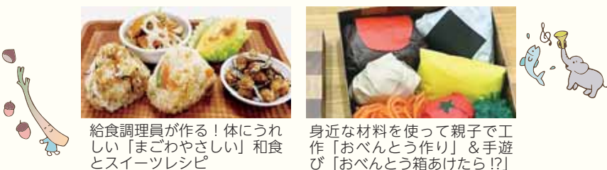
給食調理員が作る！体にうれしい「まごやさしい」和食とスイーツレシピ