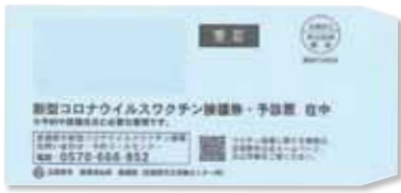
この封筒が届きます