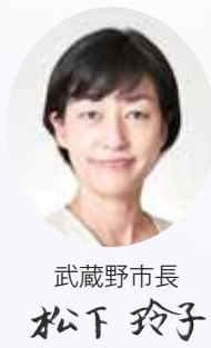
武蔵野市長 松下 玲子

「令和3年度一般会計補正予算(第3回)・5億6736万9000円」を、令和3年第2回市議会定例会に上程し、可決されました。市の対応方針の全文は市HPに掲載しています ▶ 問：各取り組みについて…各課、対応方針の策定について…企画調整課 ☎60-1801