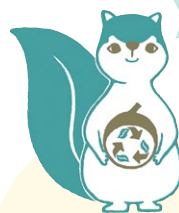
むさしのエコreゾート キャラクター〈エコリス〉

名前は 「エコリス」です！ むさしのエコreゾート 前のどんぐり広場に 住んでるよ♪