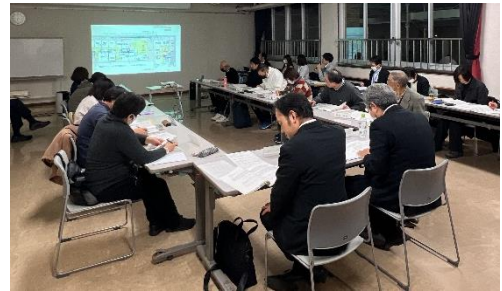
第11回改築懇談会の様子

令和6年2月7日(水)に開催された第11回改築懇談会では、基本設計概要版(案)の最終版をご説明し、ご意見をいただきました。