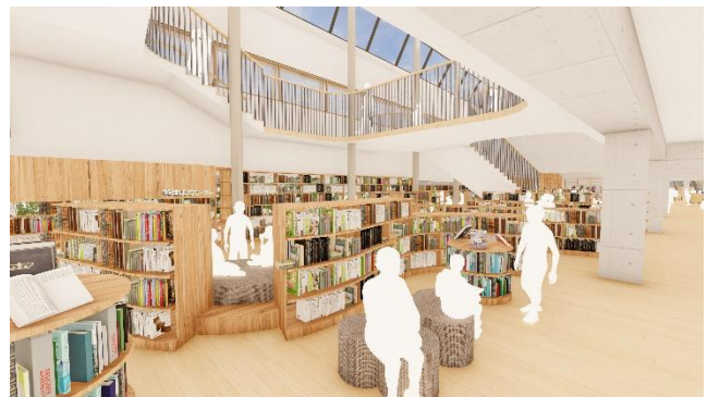
▲ラーニング・コモنزから 縦にも横にもつながる空間イメージ

住宅都市に調和するたたずまいとする／地域とともに子どもを育てる見守りやすい学校とする／記憶の継承とまちに寄り添った境界づくりを行う