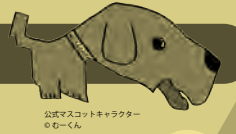
公武マスコットキャラクター のむーくん