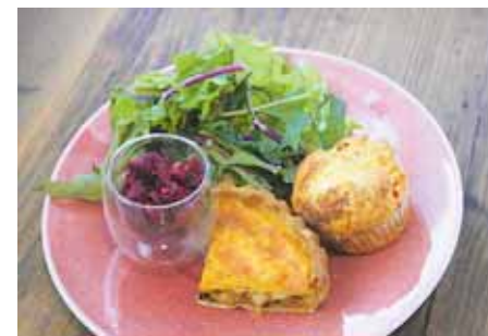
食事券で利用できるメニューの一例

市内の事業者からの返礼品のご提案、お問い合わせなどを随時受け付けています。少量でも登録可能です。返礼品の例: 市内で製造・調理している食品や料理(定食やコースメニューなどの食事券)、市内で製造・製作している雑貨や服飾品、市内で提供しているサービス(美容室、エステ、写真撮影、スポーツ・音楽レッスンなど)の利用券。