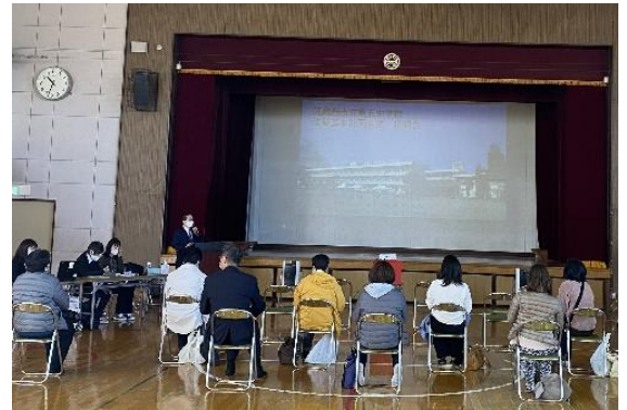
第五中素案説明会の様子 (11月15日第五小会場)