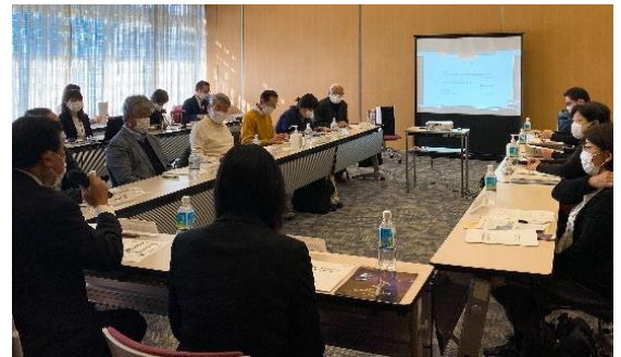
第6回五中改築懇談会の様子

引き続き改築懇談会・説明会等開催し、広く皆様にご意見をいただきながら進めていきます。