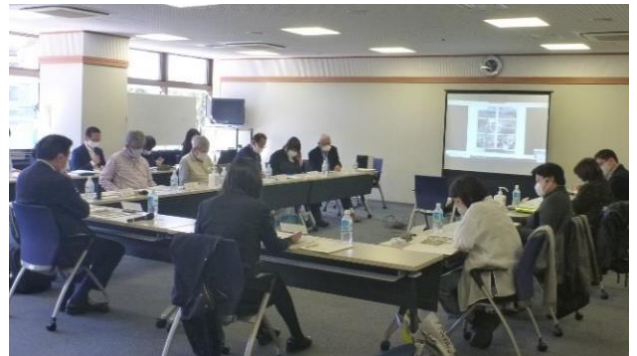
第5回五中改築懇談会の様子

第5回改築懇談会でのご意見等を踏まえて『武蔵野市立第五中学校改築基本計画素案』を作成し、『武蔵野市立第五中学校改築基本計画素案』に対する意見募集を行います。ご協力をお願いいたします。