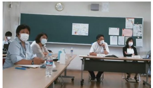
第1回第五中学校改築懇談会のようす

今年度は、学習や教育の変化に対応した施設づくりや防犯、地域連携、学校開放、避難拠点などの地域性を踏まえた施設整備の方針、配置計画などをまとめ、来年度から始まる基本設計のベースとなる「第五中学校改築基本計画」を策定します。委員のみなさまにご意見をいただきながら、策定していきます。