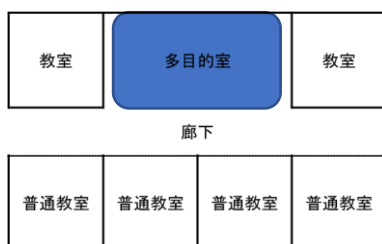
←多目的スペースイメージ

生徒だけでなく教職員もゆとりを持って活動できる職員室を整備します。自然災害に対する安全性の確保と防犯への対応を強化し、地域のつながりを育てる施設、学校開放に配慮した施設としていきます。