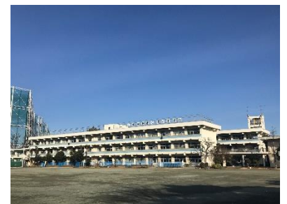
校庭から見た校舎