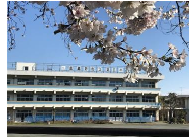
現在の第五中学校

市では、令和2(2020)年3月に『武蔵野市学校施設整備基本計画』をまとめ、昭和30～50年代に建築された学校について24年間かけて順次改築することになりました。第五中学校は、築後59年を迎えるため、今年度より建て替えに着手します。6月より学校の関係者、保護者、地域住民、教育委員会等による『改築懇談会』を設置し、建て替えに向けて動き出します。