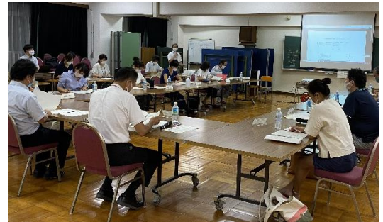
第3回一中改築懇談会の様子

第3回改築懇談会終了後には、建物配置に関する近隣アンケートを実施しました。アンケートの結果は次回の建て替えニュースでご紹介します。