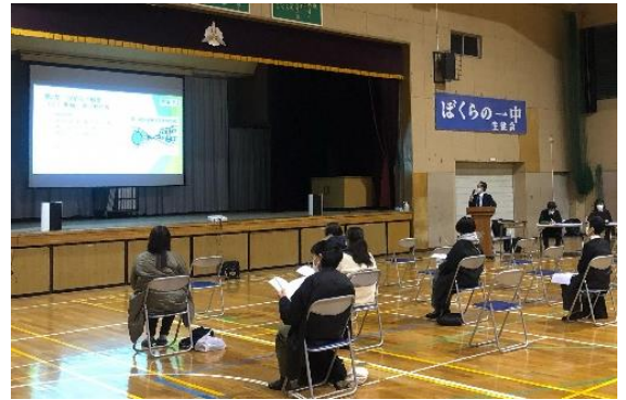
第一中素案説明会の様子 (11月24日第一中会場)

意見者数:65名(説明会での発言者を含む、第一中・第五中合計) 意見件数:128件(説明会での意見及び参考意見を含む、第一中・第五中合計)