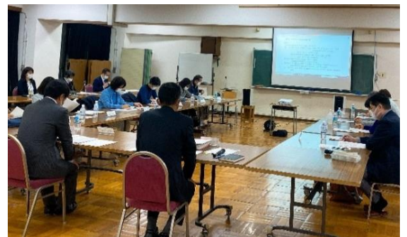
第6回一中改築懇談会の様子

引き続き改築懇談会・説明会等開催し、広く皆様にご意見をいただきながら進めていきます。