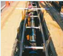
配水管更新工事の様子

水道は、私たちの日常生活に欠かせない重要なライフラインです。本市の水道事業は、24時間365日、市民の皆さんに安全な水を届けています。我が国の水道施設の多くは高度経済成長期に建設されたもので老朽化が進んでおり、修理や取り替えが必要になっていきます。本市でも同様に、施設の更新時期を迎えています▶問:水道部総務課☎54-5176