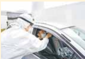
検査のデモンストレーション

市民の不安軽減と医療体制を維持するため、市が医師会や医療機関などと協力して5月21日に武蔵野市PCR検査センターを設置しました。医師会の医師による完全予約制です。ご心配な方は、受診時にかかりつけ医などにご相談ください ▶問：健康課 ☎51-0700