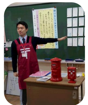
出前（手紙）授業中の様子

「手紙を書いたことやもらったことのあるお友達？」こんな質問をすると教室の子供たちは、みんな手をあげてくれます。