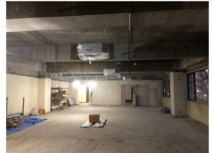
2階事務所部分 空調機器や電気配線が進んでいる