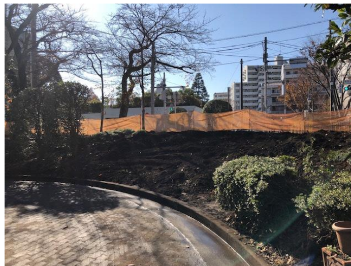
南西角 敷地内へアプローチする階段とスロープを整備