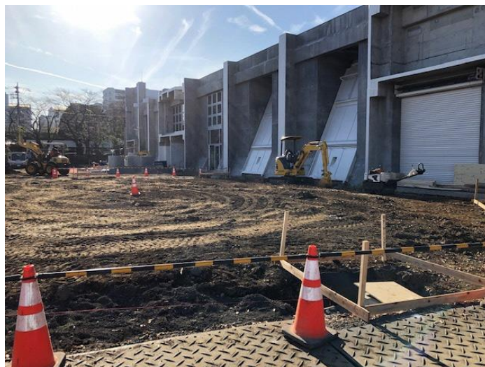
どんぐり広場の外周に雨水樹、トレンチを設置