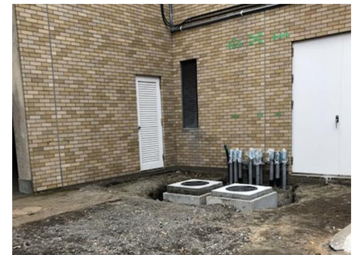
エコプラザ（仮称）への電気引き込み