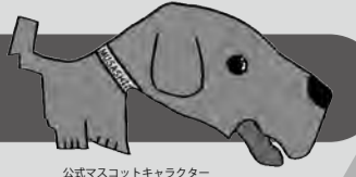
公式マスコットキャラクター ©むーくん