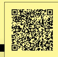
③ニチジュウスケッチ