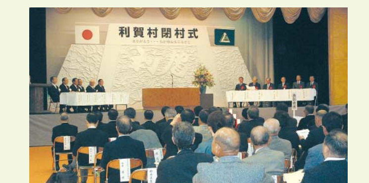
平成16年10月22日、本市の姉妹都市として、32年にわたって交流を続けてきた利賀村で閉村式が行われ、議長以下5名の議員団が出席しました。11月1日には、利賀村は近隣7町村と合併し、「南砺(なんと)市」となりました。