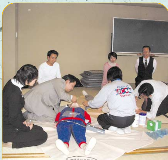
平成16年11月15日に普通救命講習会を開催し、20名の職員が参加しました。参加者は適切な救命方法について講義を受けた後、実践訓練に取り組みました。