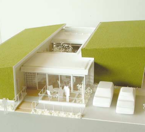
12月14日の厚生委員会、吉祥寺本町在宅介護支援センター(仮称)等の整備事業について行政報告が行われました。同施設は、吉祥寺本町4丁目旧1小子どもクラブ跡地に平成17年秋のオープンを目指して整備されるもので、在宅介護支援センターのほか、ショートステイ(4床)やミニデイサービス(定員10名)施設が併設される予定です。