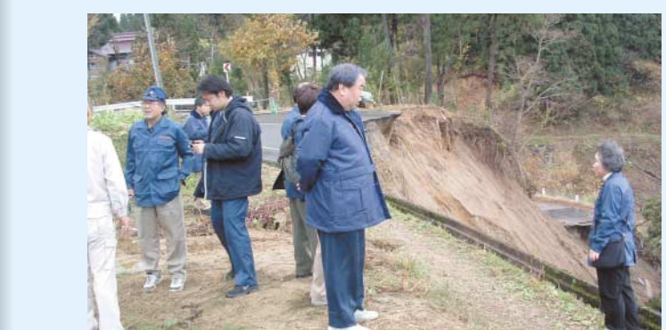
平成16年11月6日に議長が、また、11月16日に総務委員を中心とした議員7名が、新潟県中越地震で被災した友好都市の小国町を訪問し、被災状況、復旧状況を視察しました。