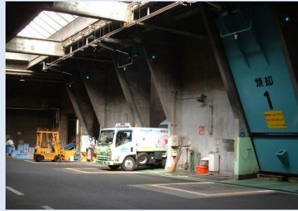
ごみ収集車がピットにごみを投入する様子

今後、エコプラザ(仮称)の機能に合わせた空間の活用方法について検討していきます。